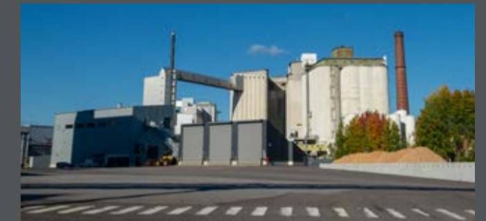
Smart Chemistry Park Raisiossa tukee tutkimuslähtöistä yritysyhteistyötä ja pk-yritysten kasvua.