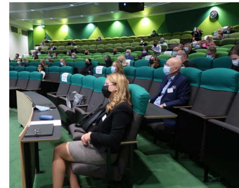
Due to COVID-19, the number of participants in the 2021 HealthBio event, among others, had to be scaled down.

The company's activities in the spearhead fields focused on sector-specific measures to increase sustainability, digitalisation and international business and attractiveness. Examples include battery industry projects supporting electrification solutions, initiatives to promote the recycling of building materials and minimise environmental impact, EDIH (European Digital Hub) project preparations supporting digital transformation and increasing the digitalisation and international competitiveness of the tourism industry.