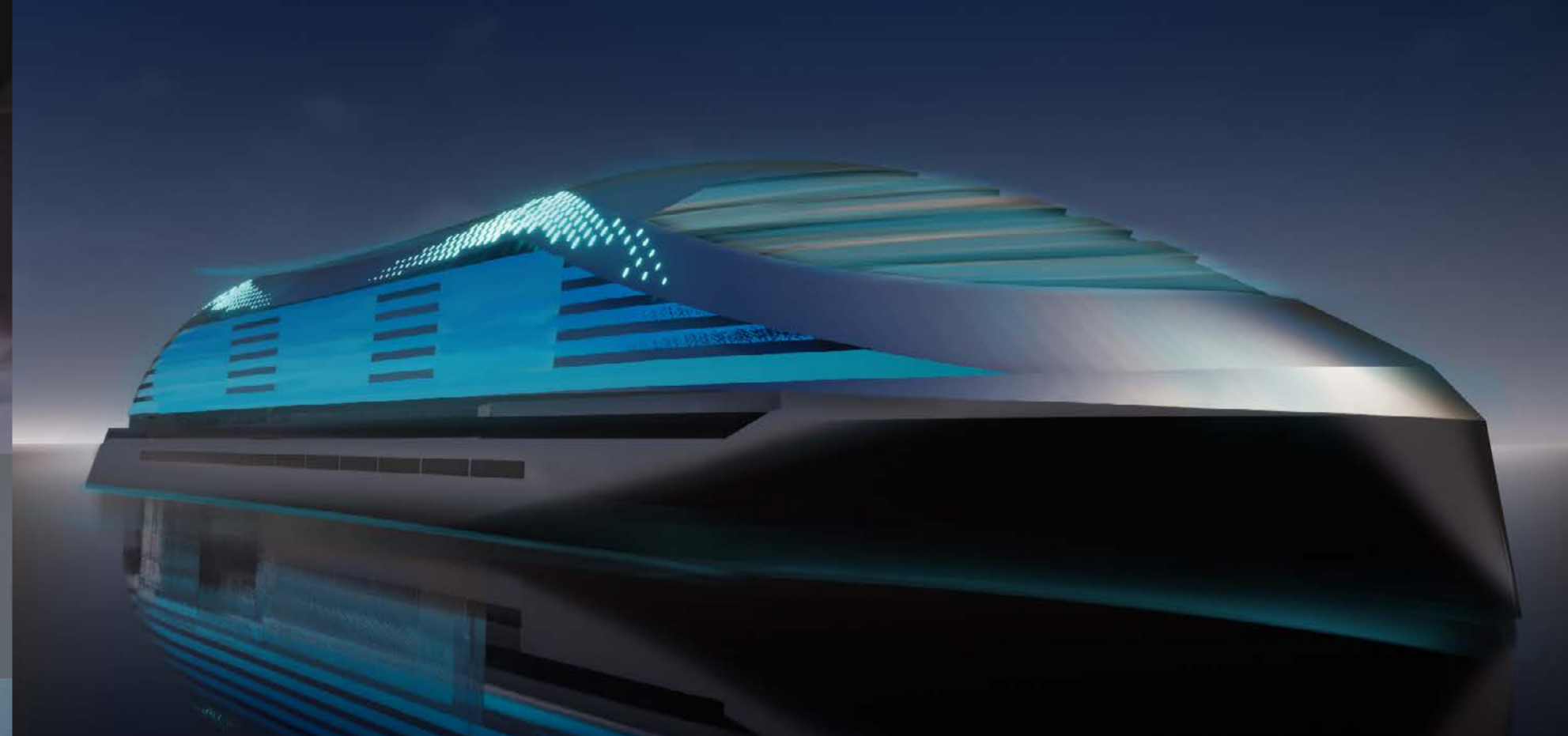
Meyer Turku Oy:n havainnekuva ilmastoneutraalista risteilijästä.