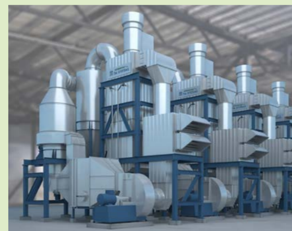
Tyypikuvassa TM System Finland Oy:n SuperDryer -kuivausjärjestelmä.

EU-komission European Innovation Council Accelerator -ohjelma rahoittaa erittäin innovatiivisia, kasvuhakuisia startup- ja pk-yrityksiä. Rahoituksessa avustuksen osuus on enintään 2,5 miljoonaa ja pääomakomponentti 0,5–15 miljoonaa euroa. Kahdella hakukieroksella ohjelma sai yli 4000 hakemusta, joista valikoitui 164 rahoitusta saanutta. Kahden turkulaisen lisäksi rahoituksen sai neljä muuta suomalaisyritystä.